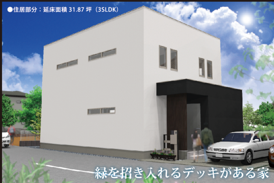
緑を招き入れるデッキがある家