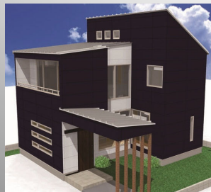
K様邸完成予定パース