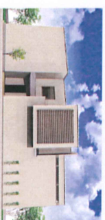
坂戸市TM様邸完成予想CG

3月19（土）～21日（祝日） 鶴ヶ島市脚折町 4-14-7 E's Design House の フライングイベントを開催！