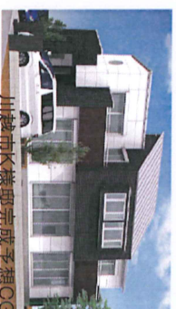
川越市K様邸完成予想CG

2月19（土）、20日（日） 川越市的場 2201-3にて 完成見学会を開催します！