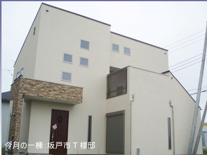
今月の一棟: 坂戸市 T 様邸