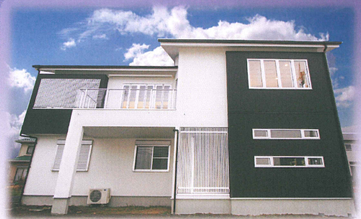
今月の一棟: 川越市 H 様邸