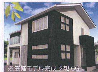
※笠幡モデル完成予想CG

ホームページ: www.blbuild.co.jp / ブログ: http://blogs.yahoo.co.jp/r3d_office