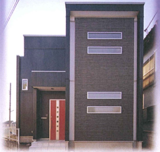
今月の一棟：川越市N様邸