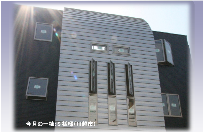
今月の一棟: S 様邸(川越市)