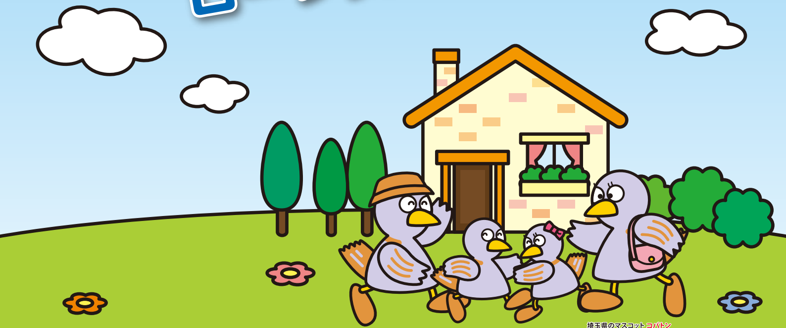
埼玉県のマスコットヨバトン