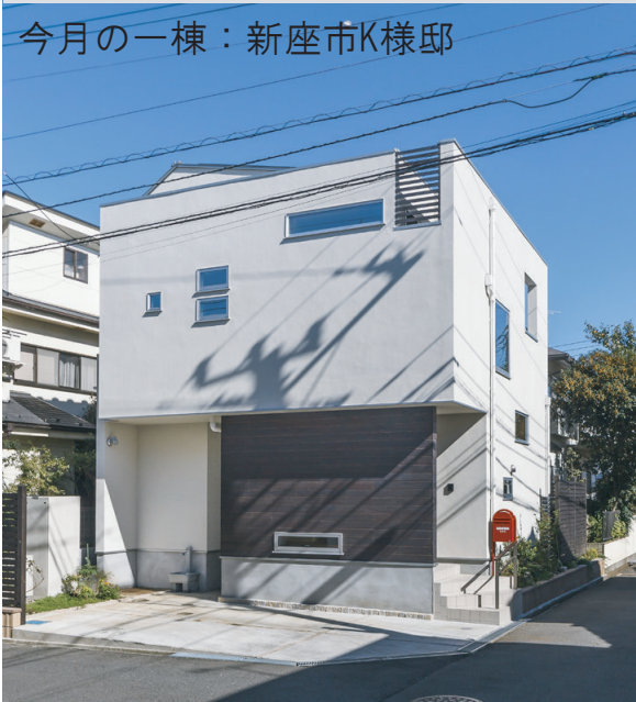
今月の一棟：新座市K様邸