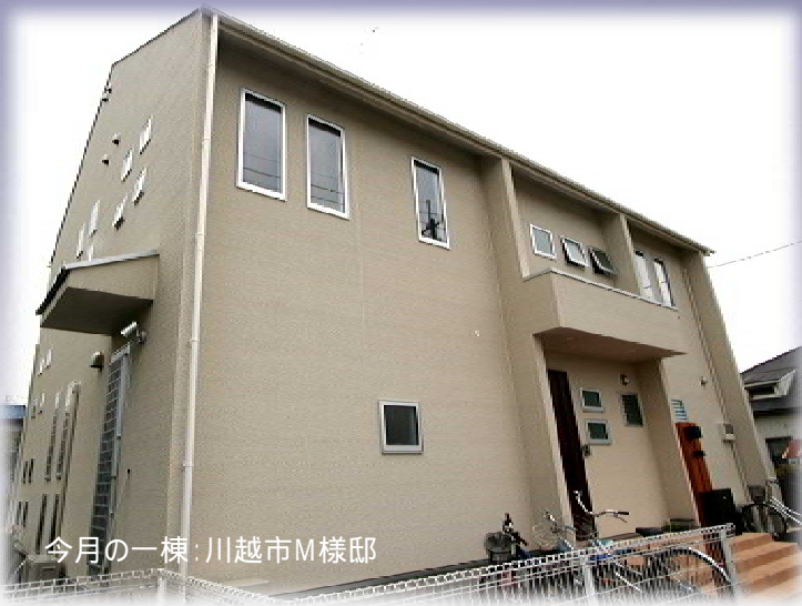
今月の一棟: 川越市M様邸